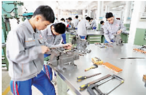
完善的实训设备,提高了学生的专业技能。P16C285147

据悉,成立闽南传统工艺传承基地,只是学校迈出的第一步。今后,集美工业学校将打造厦门传统工艺旅游基地、产业基地,甚至设立闽南传统工艺博物馆,使其成为厦门一张的闪亮名片。