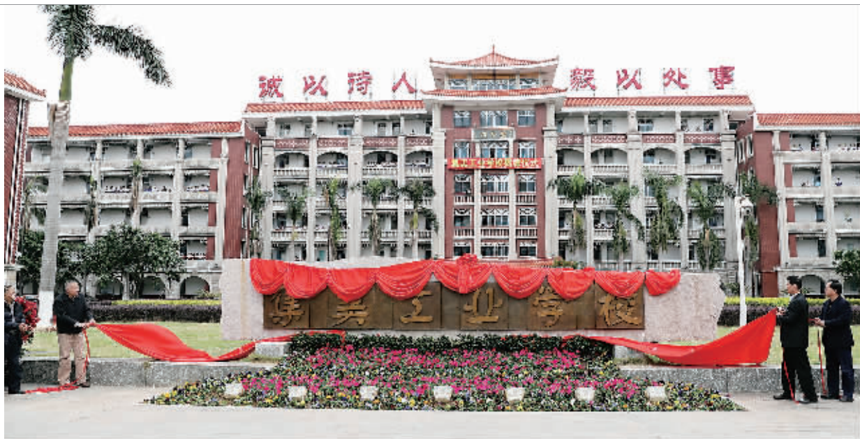
集美工业学校正式亮相。 P16C285145

昨天,集美学村迎来发展壮大的里程碑事件——集美工业学校正式揭牌。昨天是她的生日,但她同时也拥有近百年的辉煌历史——她是由96岁的集美轻工业学校与58岁的福建化工学校强强整合而成。她出身不凡,起点不凡,致力于新的使命,在新的时代,树起现代职业教育工科类厦门最强的大旗,迈出新的征程。